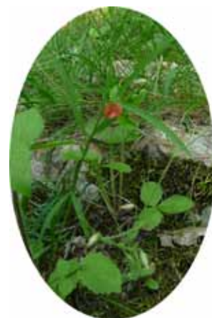
Gesse à graines sphériques

L'accompagnement des communes par JNE se poursuivra jusqu'en décembre 2011. Mais les seuls gages de préservation durable de ces pelouses sèches sont l'implication de la population locale dans le respect et l'entretien de cet espace naturel. L'écovolontariat, action éco-citoyenne par excellence, est l'un des principaux outils à notre disposition.