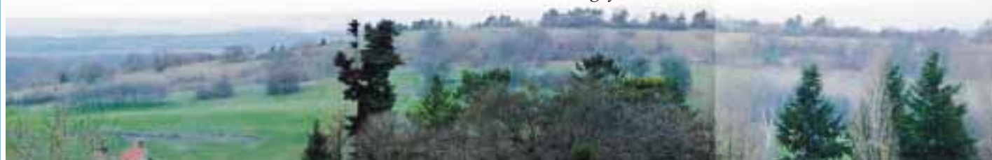
Pelouse restaurée de Chevigny