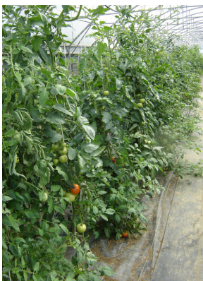
culture maraîchère biologique dans le Jura (2009).

Dans le département, la surface toujours en herbe a enregistré la plus forte progression avec +11.70 % entre 2007 et 2008, alors que dans le même temps celle des autres fourrages diminuait de -21.78%. Quant aux céréales et aux oléa-protéagineux, à la vigne et aux légumes, leur surface a progressé respectivement de +4.90%, +7.14% et +10.58%.