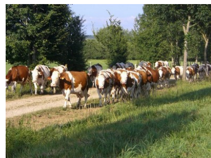
des Montbéliardes qui vont à la traite (2009).

Malgré cela, le département reste le seul à compter des brebis à lait élevées en mode « bio » avec 92 bêtes.