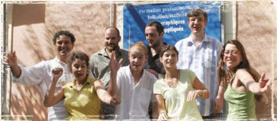
IMAGE Formation dispense à Nîmes (30) des formations aux métiers d'avenir, web designer, webmaster, PAO, robotique... sous statut associatif depuis 1993. En janvier 2009, elle s'est transformée en Scop, 9 salariés sur 15 sont associés.

L'union fait la force, tel pourrait être le credo des Scop! A la différence des entreprises classiques où c'est souvent chacun pour soi, en Scop, l'entraide et la solidarité prennent tout leur sens puisque tout le monde poursuit le même objectif: la bonne marche de l'entreprise. Avec des statuts démocratiques qui assurent la cohésion et une meilleure valorisation des métiers et savoir-faire.